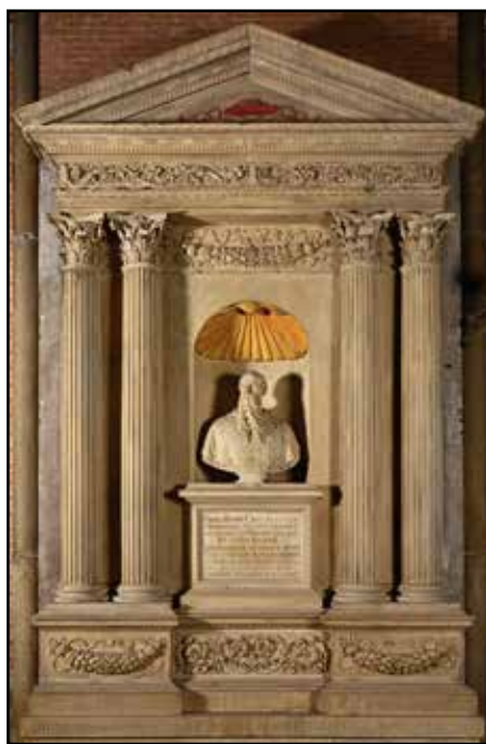
Danese Cattaneo Cenotafio di Pietro Bembo Padova, basilica del Santo