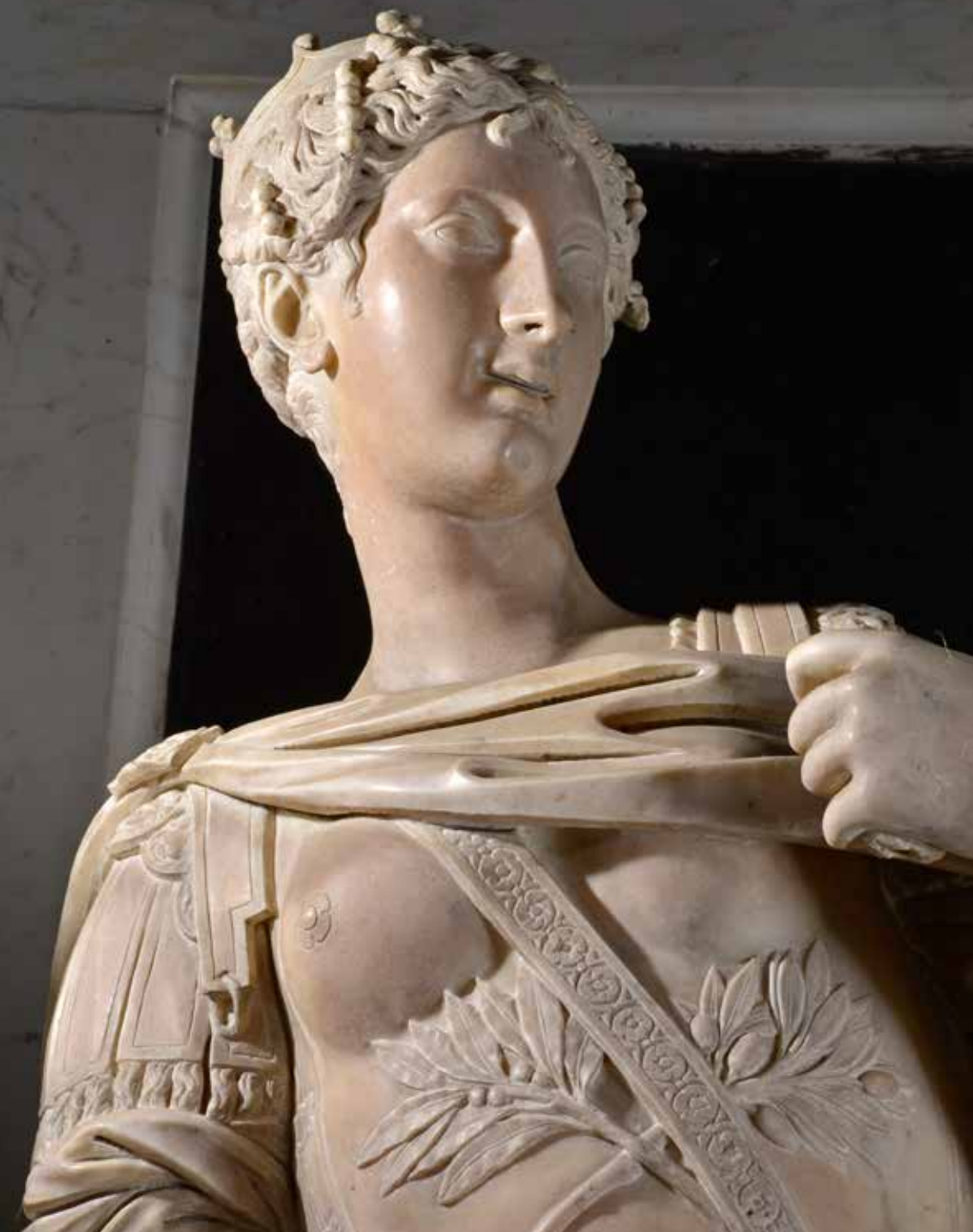
Danese Cattaneo Monumento Loredan, Venezia Armata, particolare Venezia, chiesa dei Santi Giovanni e Paolo