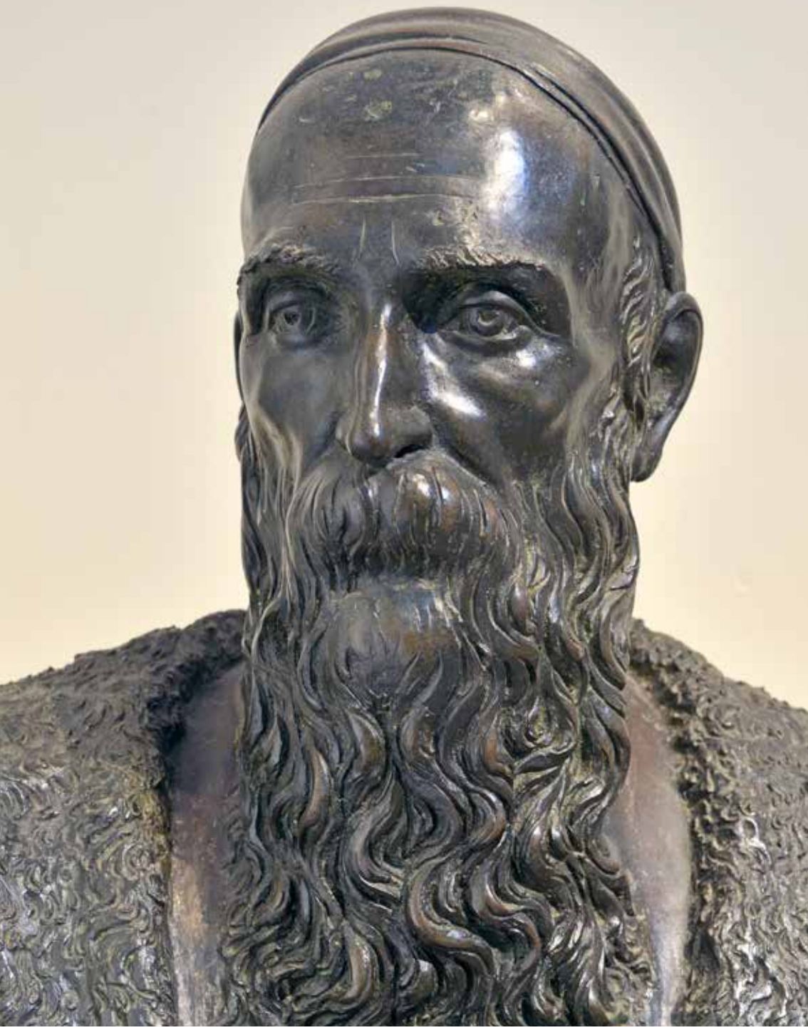
Danese Cattaneo Busto di Lazzaro Bonamico, particolare Bassano, Museo Civico