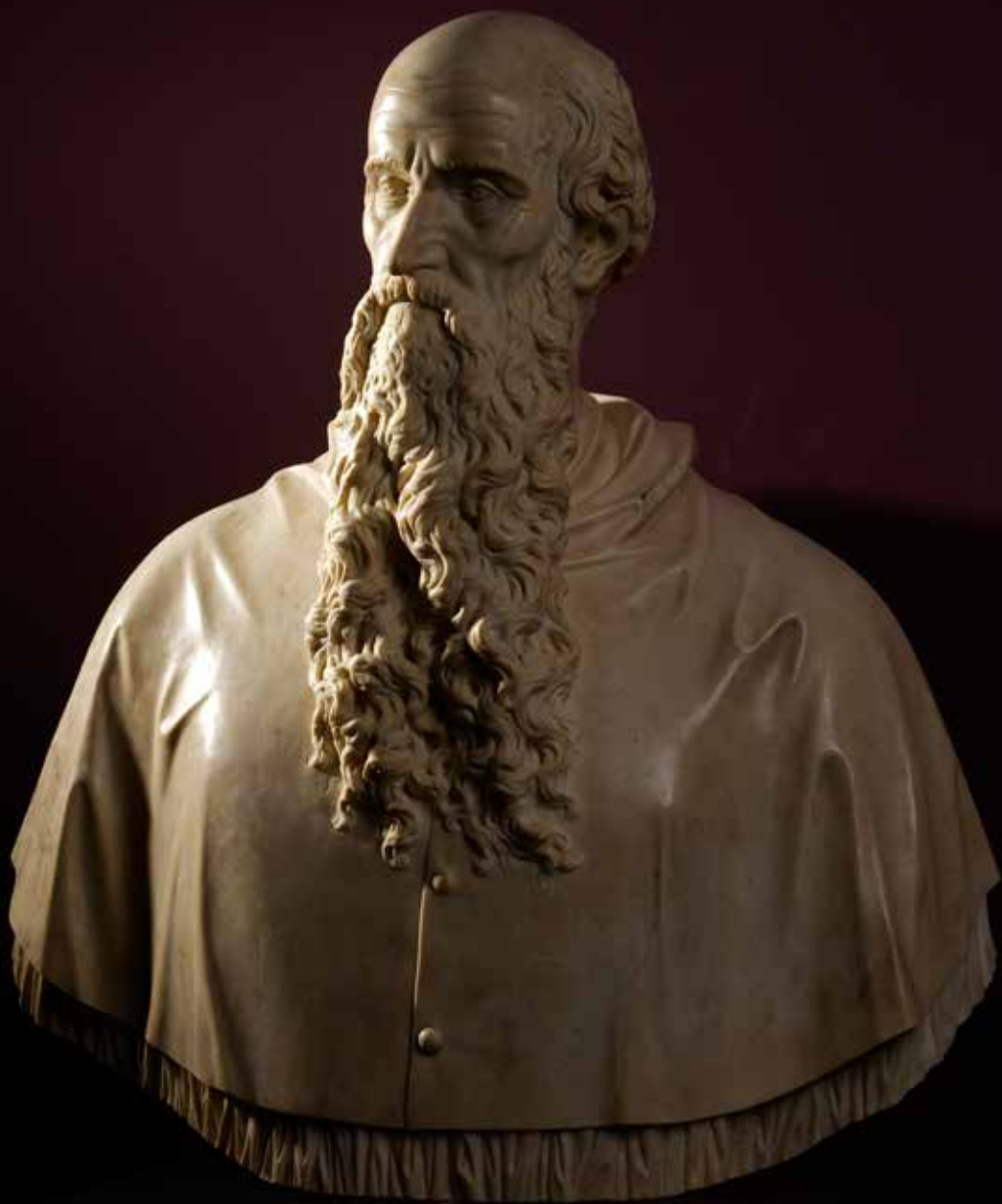
Danese Cattaneo Busto di Pietro Bembo Padova, basilica del Santo