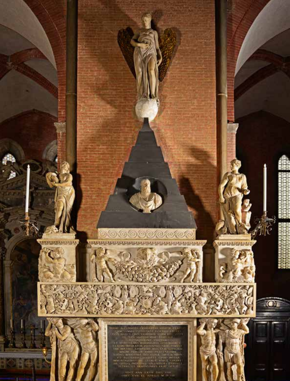
Michele Sanmicheli, Alessandro Vittoria, Pietro da Salò, Agostino Zoppo, Danese Cattaneo Monumento funebre di Alessandro Contarini Padova, basilica del Santo