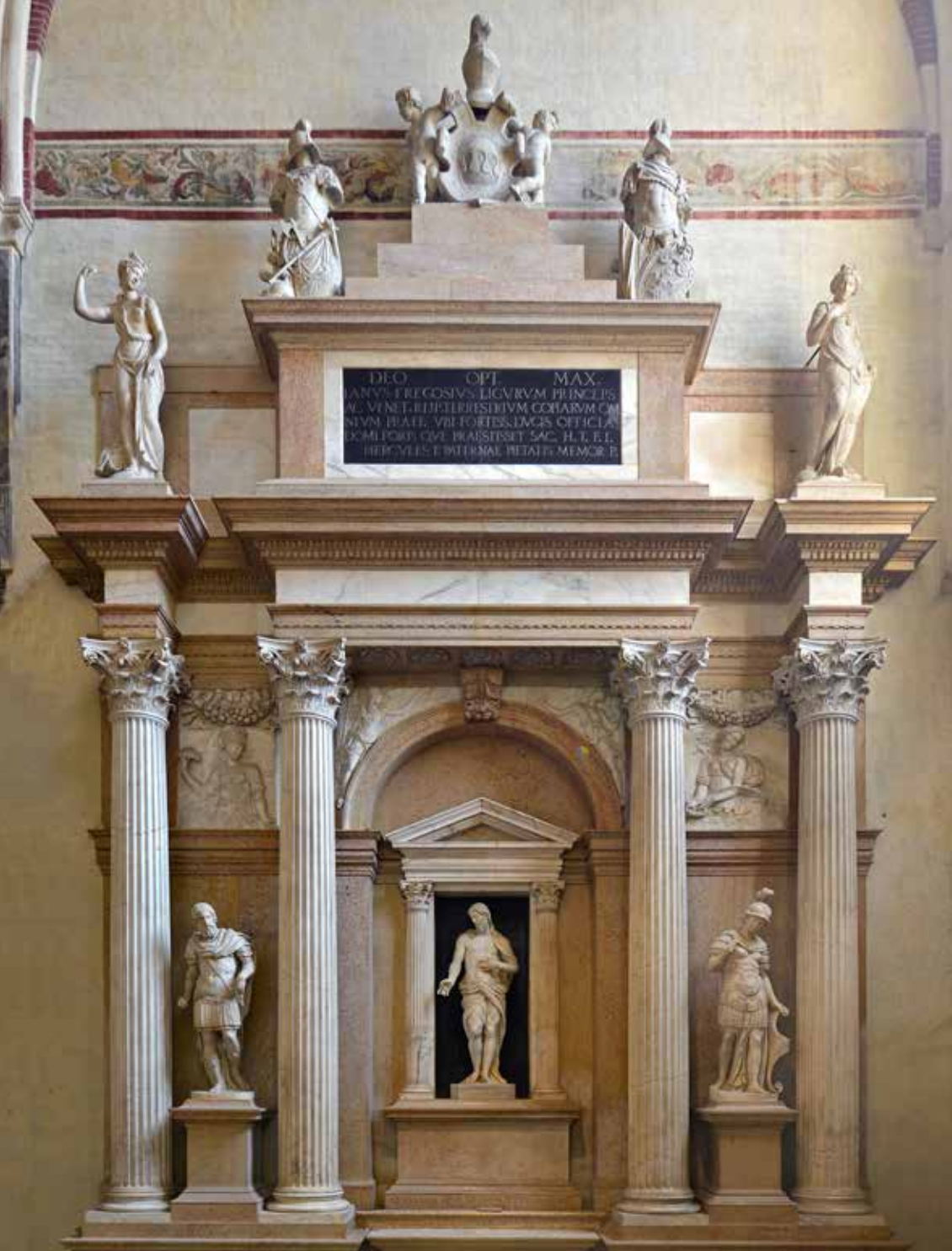
Danese Cattaneo Monumento a Gian II Fregoso Verona, basilica di Santa Anastasia